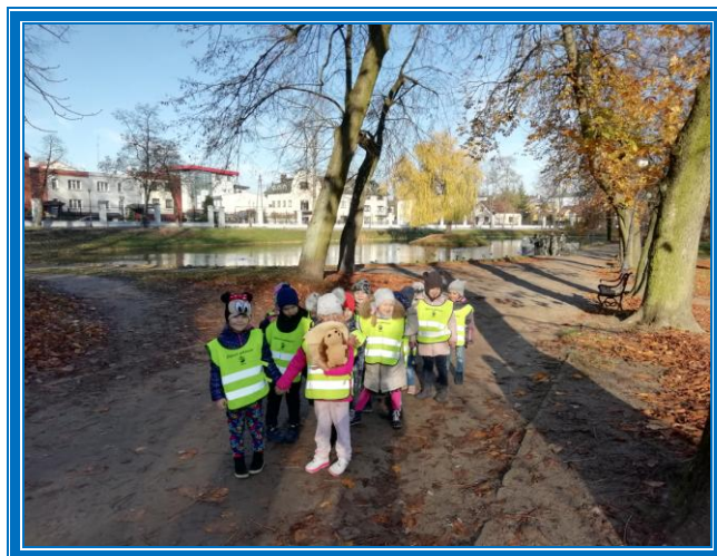
PARK MIEJSKI ALEKSANDRIA