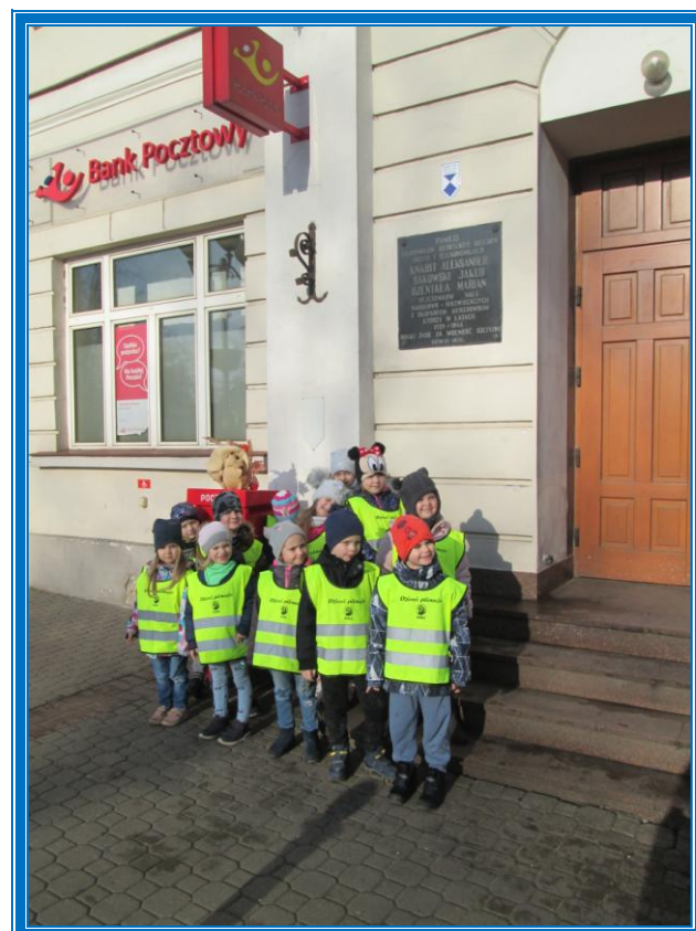
BUDYNEK POCZTY POLSKIEJ