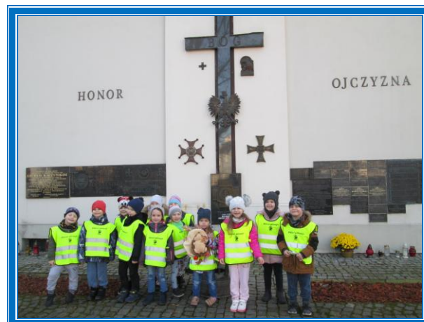
KOŚCIÓŁ PW. ŚW. STANISŁAWA BM

Wspólnie zaprojektowaliśmy pocztówkę naszego miasta i ułożyliśmy krótką rymowanąkę. 😊