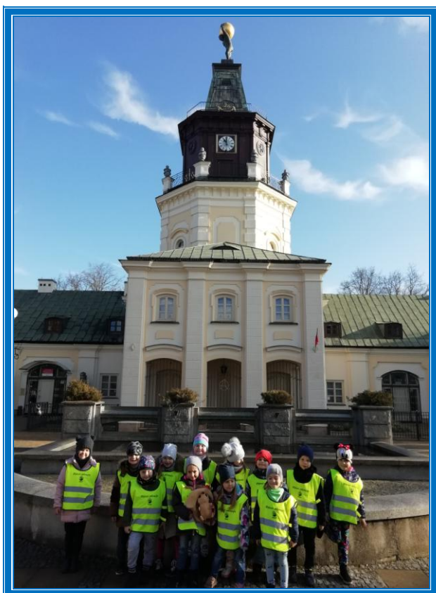
RATUSZ MIEJSKI JACEK