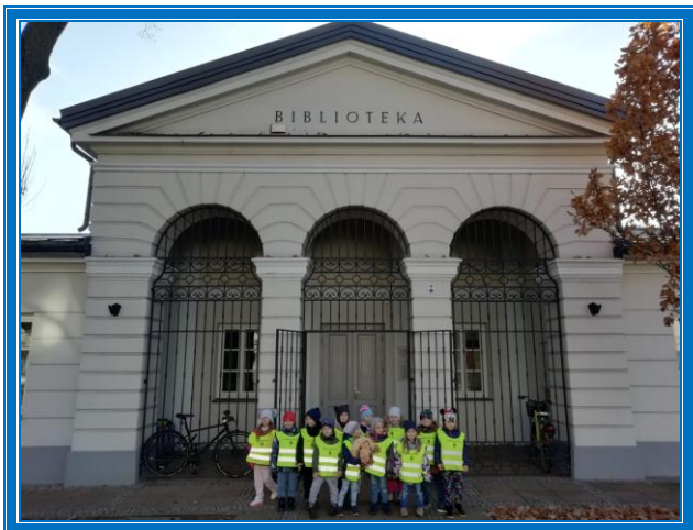
MIEJSKA BIBLIOTEKA PUBLICZNA