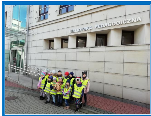
BIBLIOTEKA PEDAGOGICZNA IM. HELENY RADLIŃSKIEJ