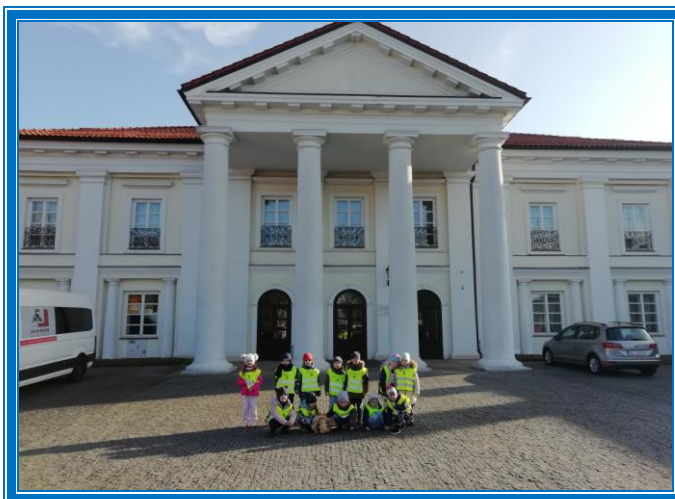
ZESPÓŁ PAŁACOWO - OGRODOWY (PAŁAC OGIŃSKICH)